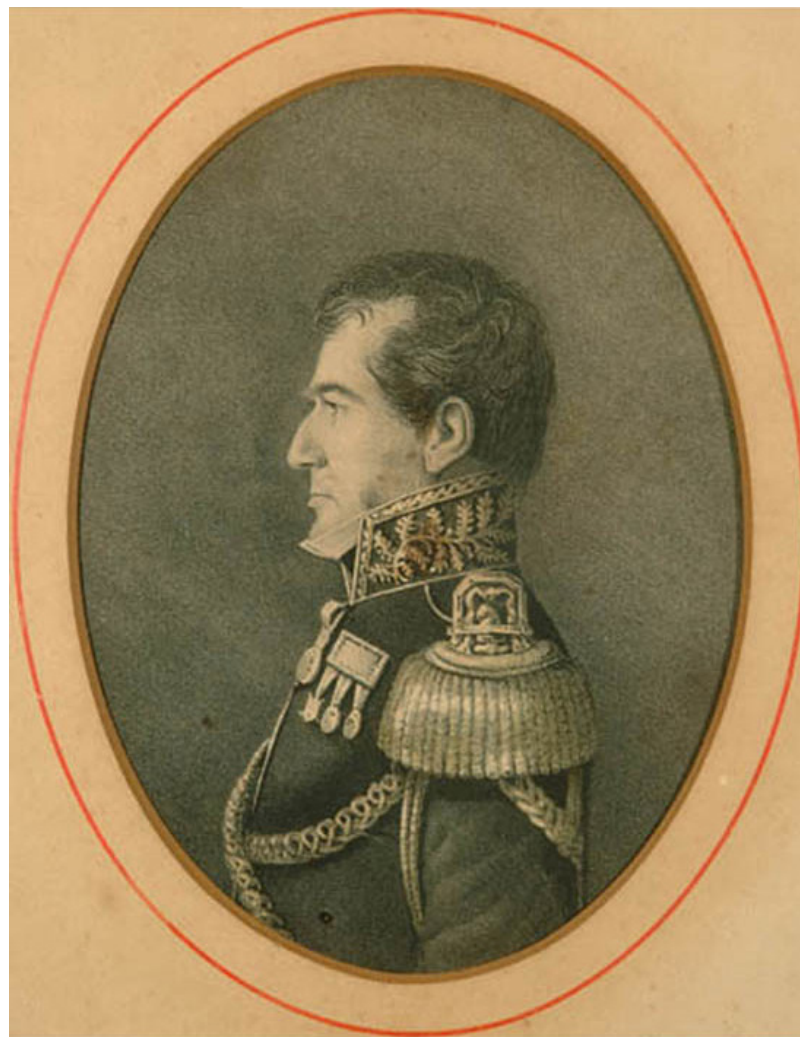
Cuadro conteniendo un retrato del Gral. Lucio Mansilla, (litografía), mide 41x32 cm.

El general Lucio Mansilla estuvo al frente de las fuerzas de la Confederación. Se dispusieron alrededor de 160 cañones en la margen derecha del río, se tendieron tres cadenas de considerable grosor de costa a costa —apoyadas en más de veinte embarcaciones, muchos de ellos cargados con explosivos—, se posicionaron alrededor de dos mil milicianos, principalmente gauchos acompañados también por mujeres, en ambos márgenes del río. Después de varias horas de combate, el triunfo fue para la flota anglofrancesa, que generó numerosos muertos y heridos en las filas de la Confederación. Sin embargo, la victoria obtenida en el campo de batalla no pudo sostenerse, ya que en distintos puertos del río Paraná la flota anglofrancesa fue resistida y se encontraron con nuevos ataques en San Lorenzo y Tonelero.