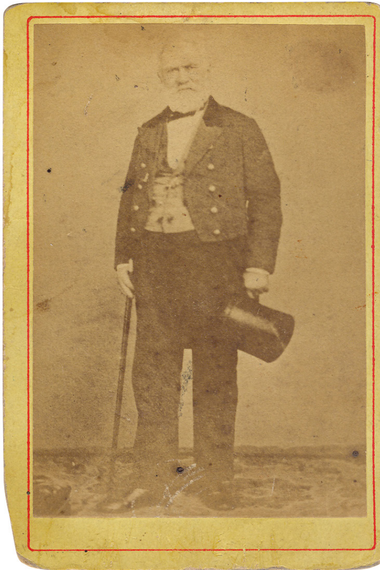
Fotografía del General Lucio Mansilla