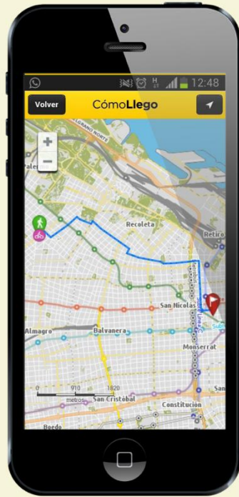
APP BA Móvil

Te ofrecemos distintas herramientas impresas y digitales para ayudarlos a planificar sus viajes en bici, conocer las ubicaciones de las estaciones EcoBici y los espacios de estacionamiento de bicicletas en la Ciudad.