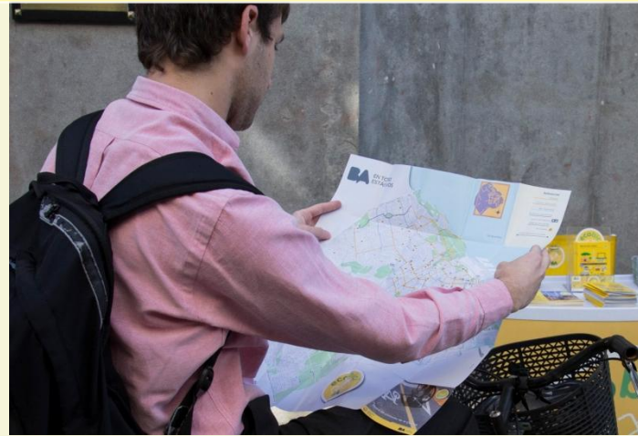
Mapa de la Red de Ciclovías