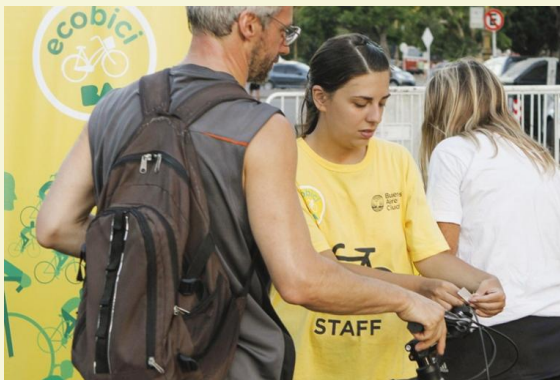
Estacionamiento gratuito en eventos masivos