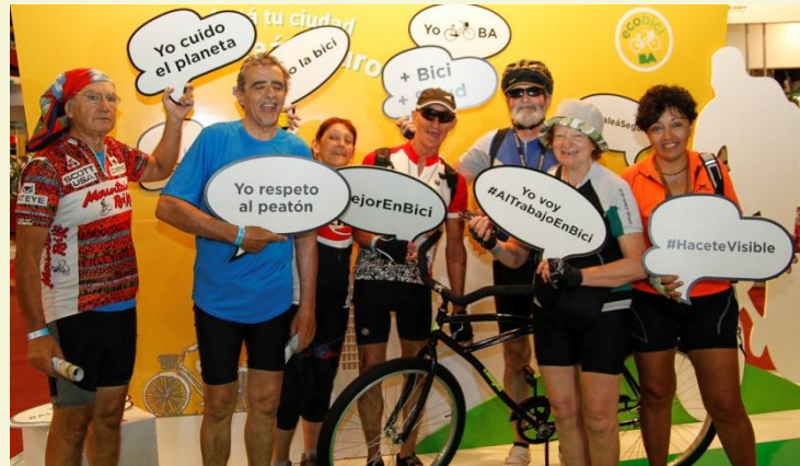
Festival de la bici