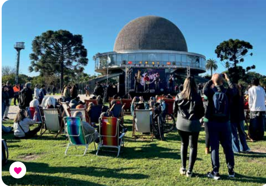
@ - Planetario BA