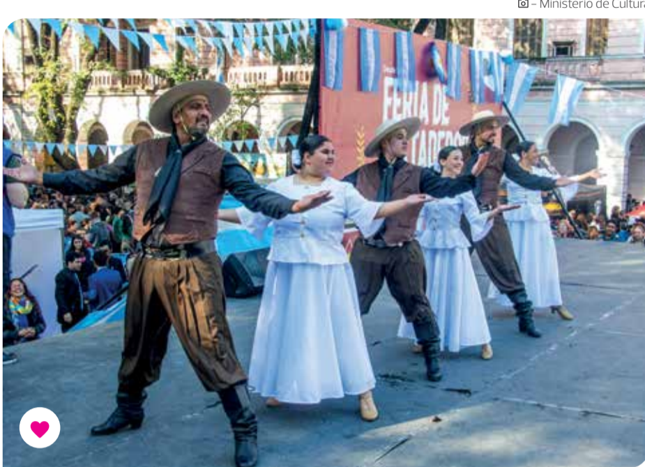
Instagram - Ministerio de Cultura