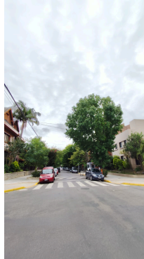
FOTO - CORREDOR DESPUÉS