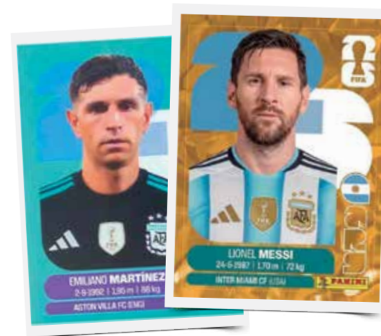
El Dibu y Messi. Las "fichus" que todos quieren tener.