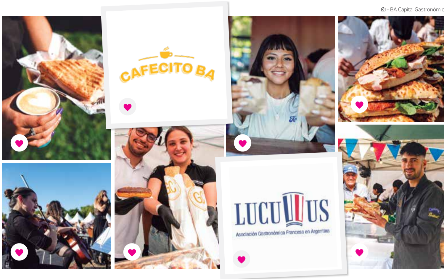
BA Capital Gastronómica