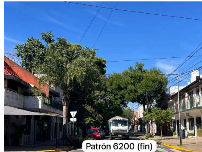
Patrón 6200 (fin)