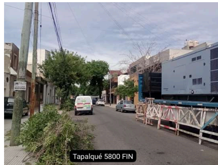
Tapalqué 5800 FIN