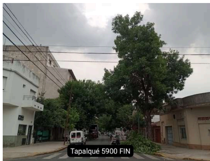
Tapalqué 5900 FIN