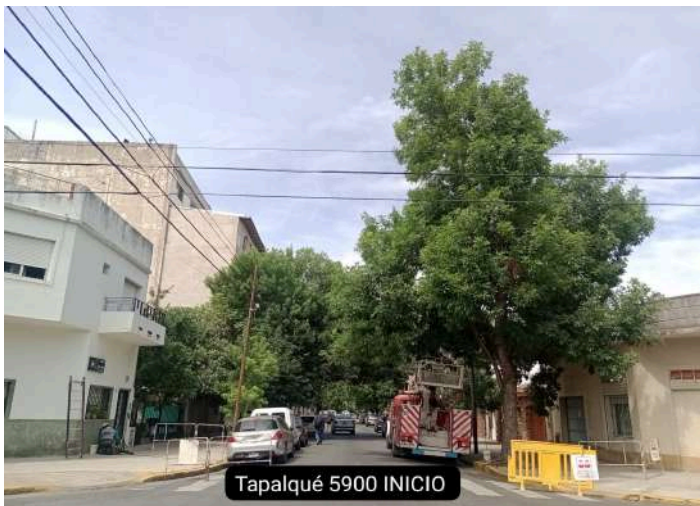
Tapalqué 5900 INICIO