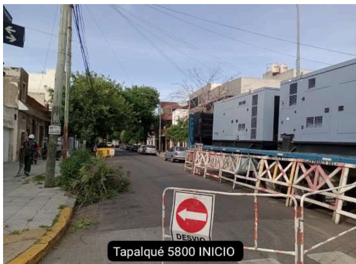
Tapalqué 5800 INICIO