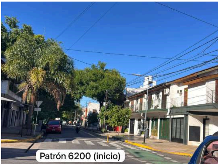
Patrón 6200 (inicio)