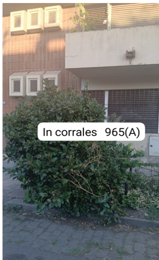
In corrales 965(A)