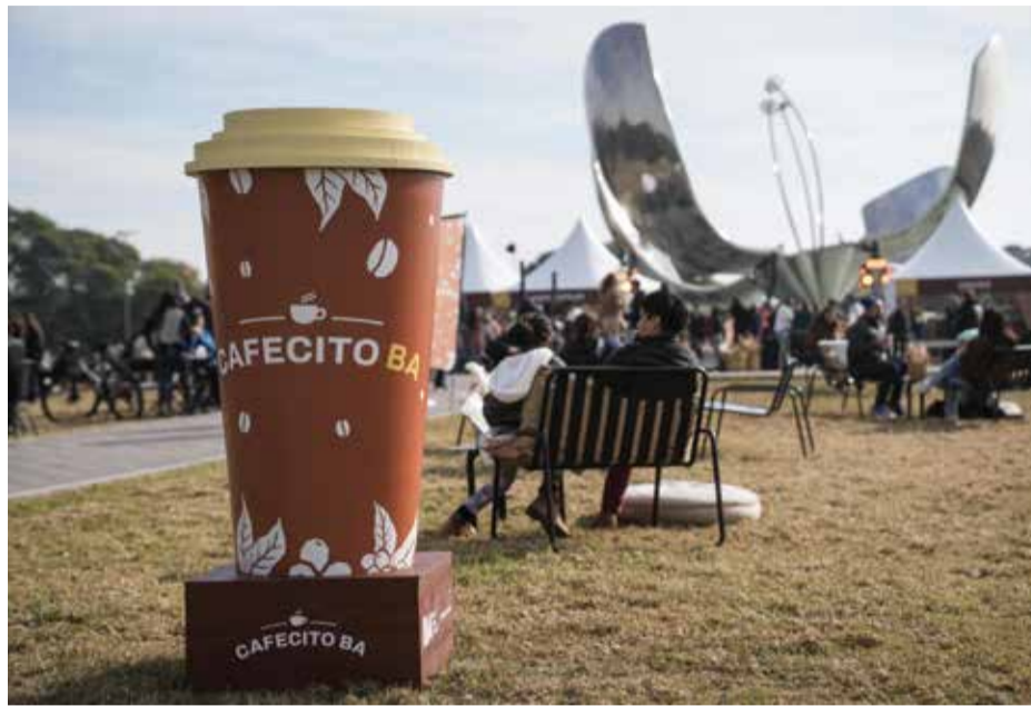
BA Capital Gastronómica

Más info: buenosaires.gov.ar/DescubrirBA