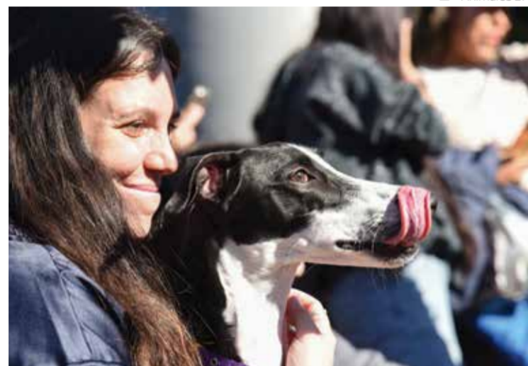
@ - Animales BA

En 2025, 378 perros y gatos encontraron un hogar gracias a las Jornadas, un número que refleja el alcance real de la iniciativa e invita a reflexionar sobre su impacto concreto. Detrás de esa cifra hay historias y vidas