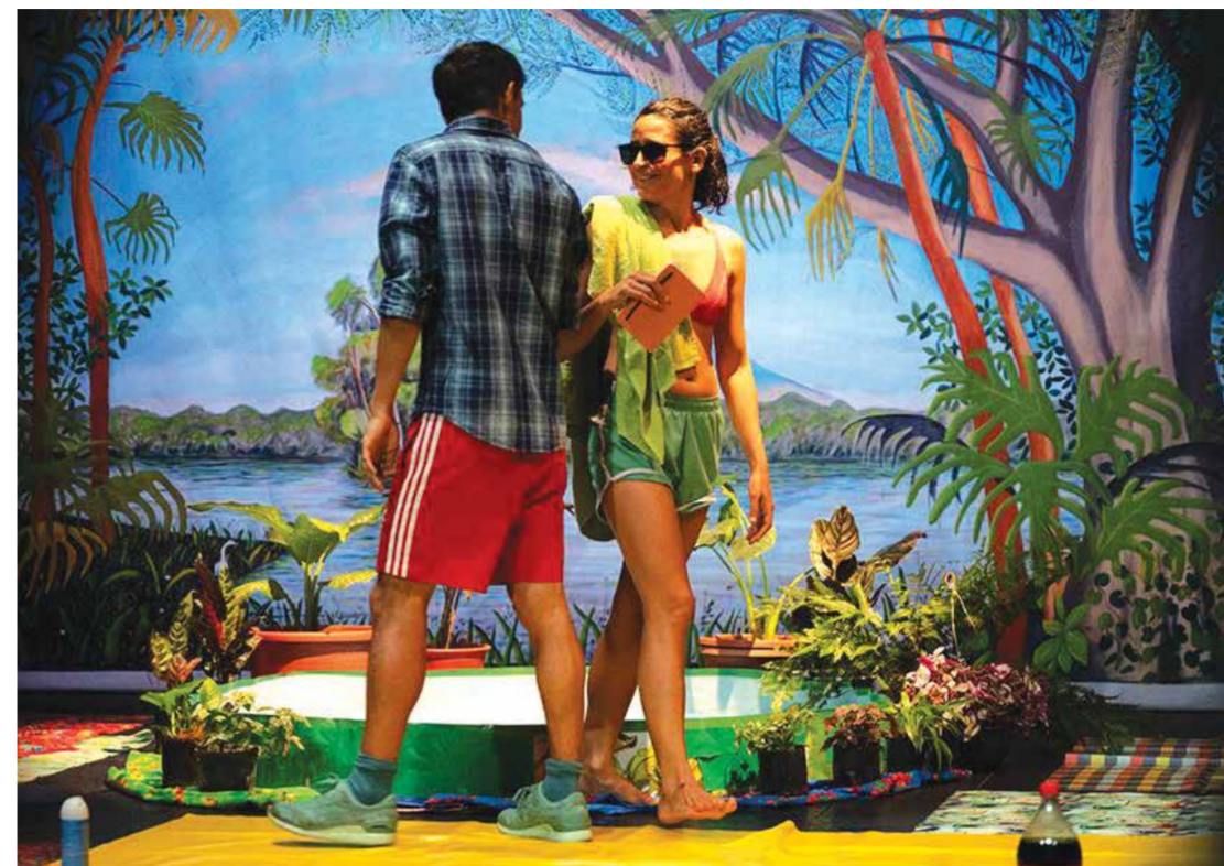
@ - CTBA

Centroamérica. Lagartijas tiradas al sol, el colectivo de artistas mexicanos que trabaja sobre acontecimientos de la realidad con un lenguaje escénico propio.