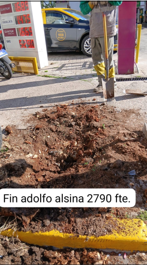
Fin adolfo alsina 2790 fte.