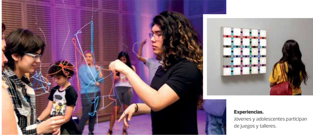
Experiencias. Jóvenes y adolescentes participan de juegos y talleres.