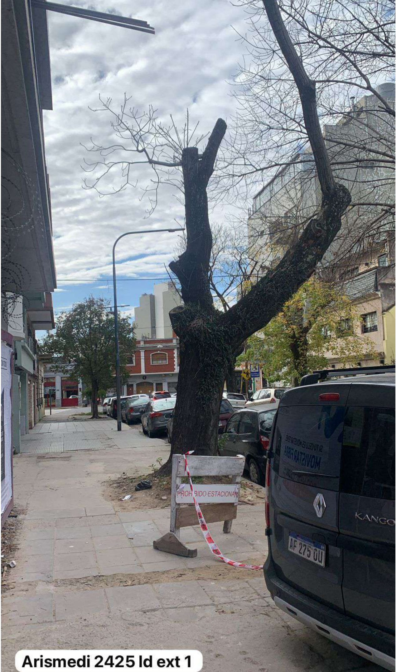
Arismendi 2425 Id ext 1