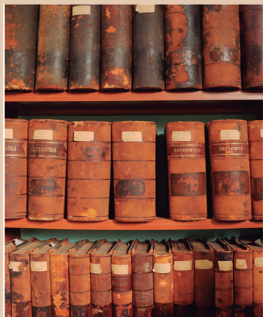
COLECCIÓN BIBLIOGRÁFICA HISTÓRICA IZLP 1886-1988

Corpus Documental de la Evolución Epidemiológica de la Rabia en la Argentina