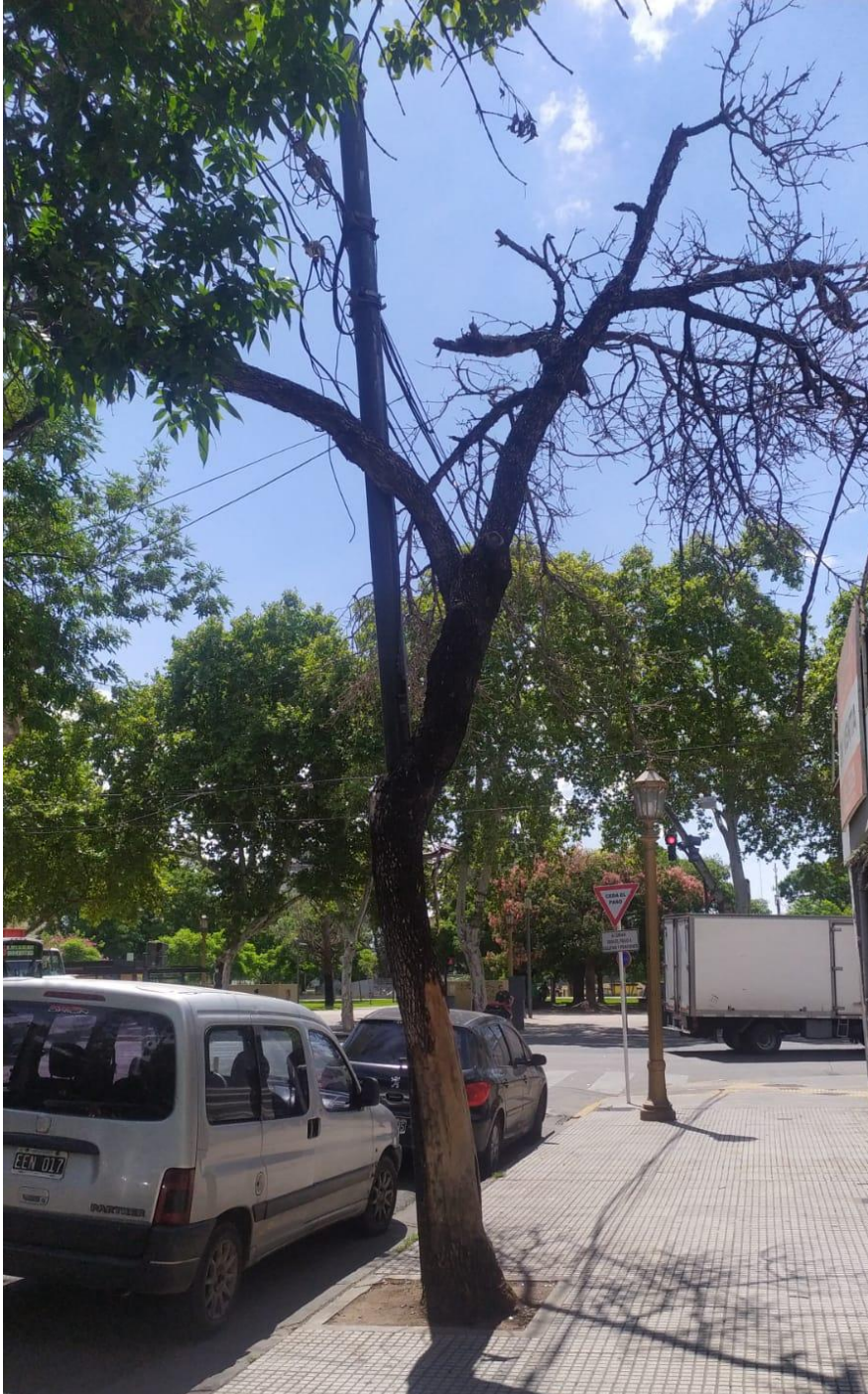
Imagen 1. Vista del árbol