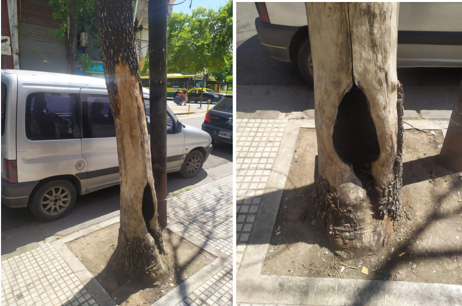
imágenes 2 y 3. Vista lateral y frente de la cavidad basal