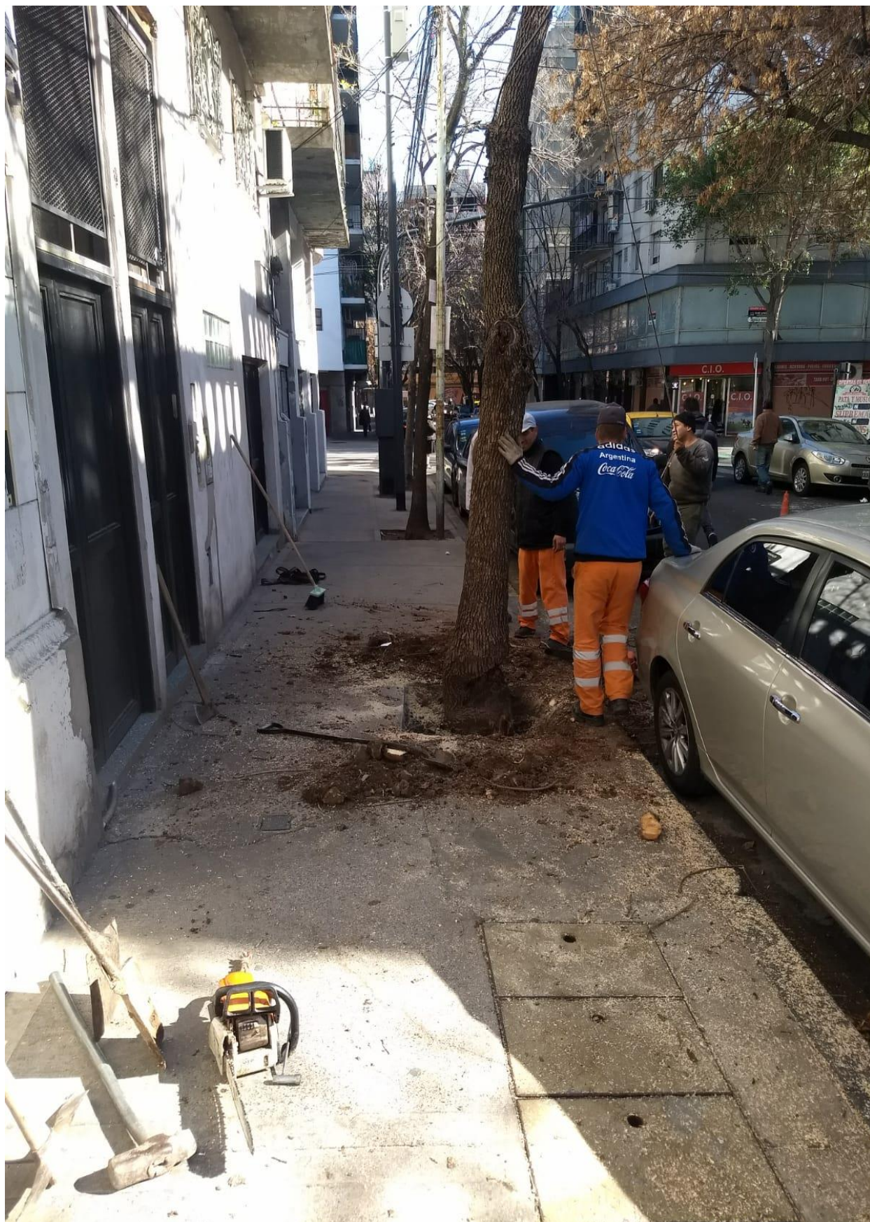
VIAMONTE 2872 ANTES