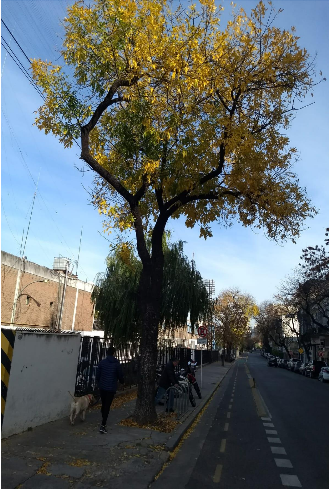
Perón Juan Domingo, TTE Gral. 2930 ANTES