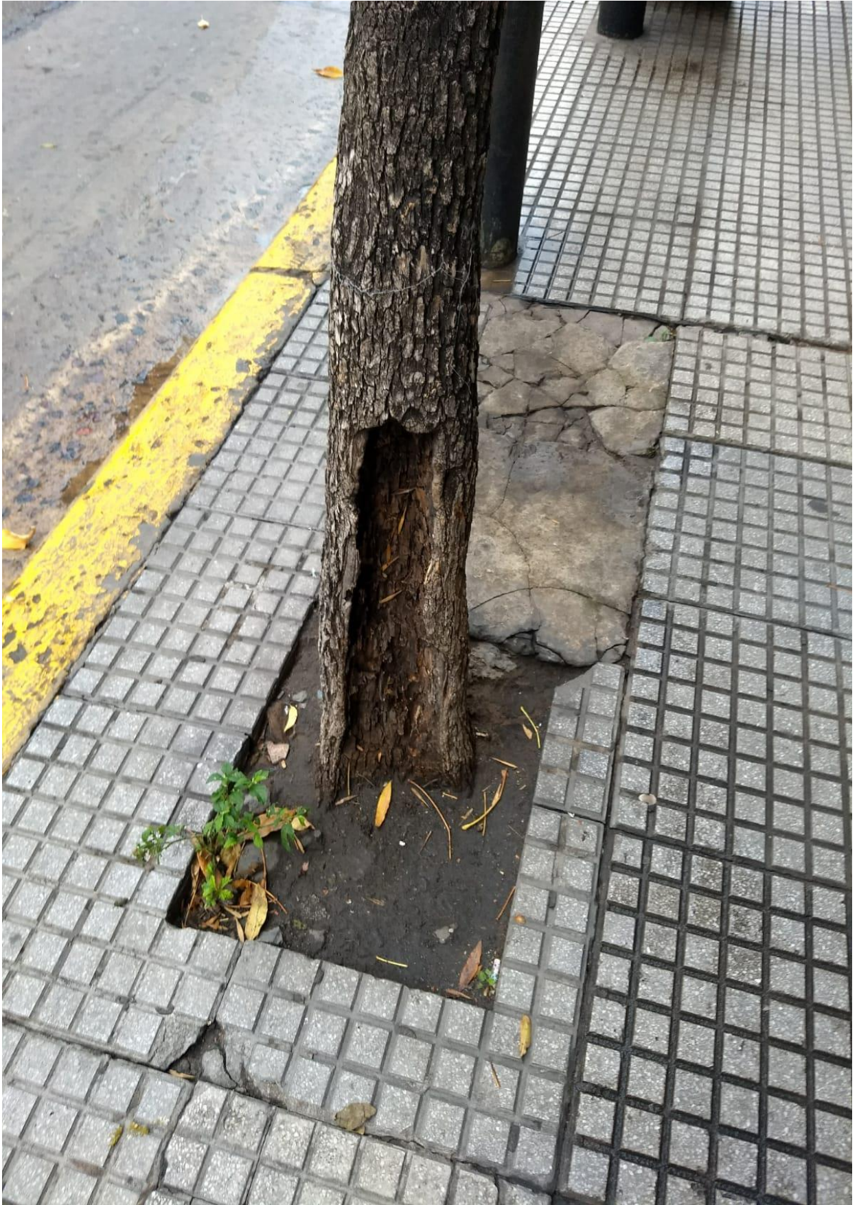
Av. Córdoba 2634 ANTES