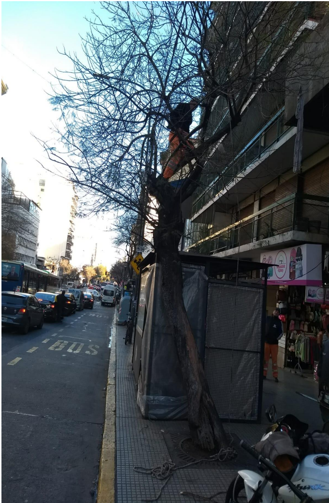
AV. RIVADAVIA 2551 ANTES