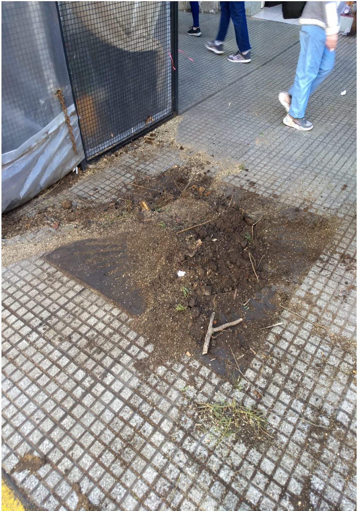
AV. RIVADAVIA 2551 DESPUÉS