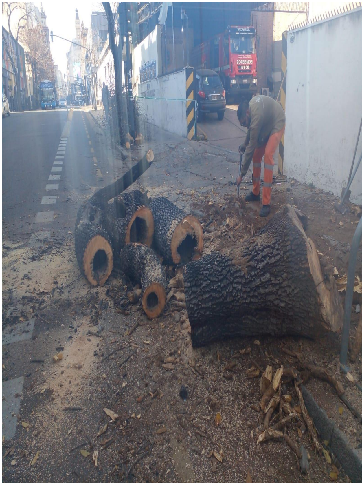
Perón Juan Domingo, TTE Gral. 2930 DESPUÉS