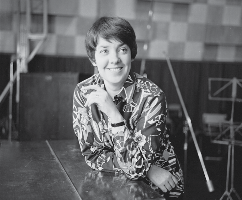
María Elena Walsh - 1963