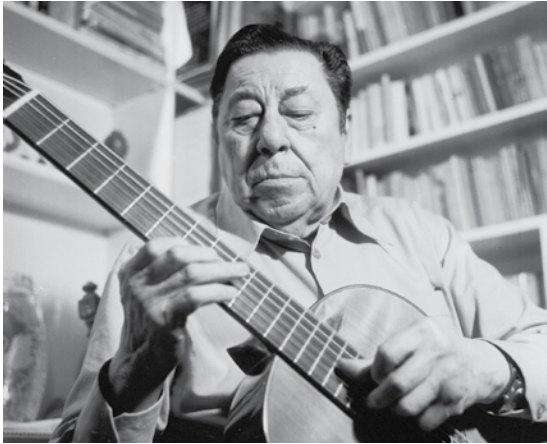
Atahualpa Yupanqui - 1981