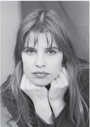
Fabiana Cantilo - 1984

ro de la fotografía, que reúne 80 imágenes, la mayoría en blanco y negro, de artistas de folklore, tango, rock, el pop, melódico y de músicos del exterior. Esta exposición llega acompañada a su vez de un libro de más de 500 páginas que recoge el material en una edición histórica.