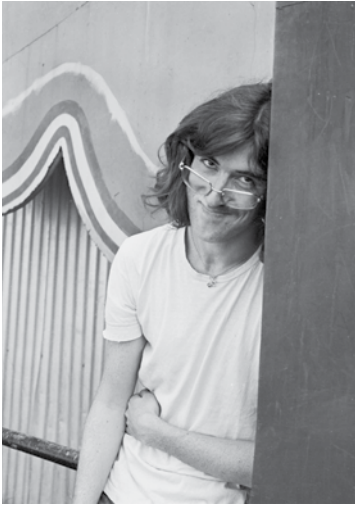
Charly García - 1982